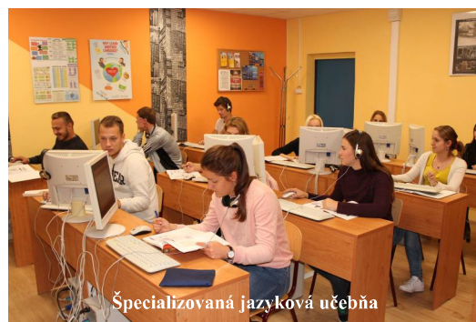
Špecializovaná jazyková učebňa