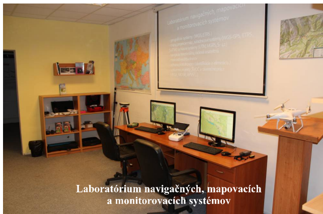
Laboratórium navigačných, mapovacích a monitorovacích systémov