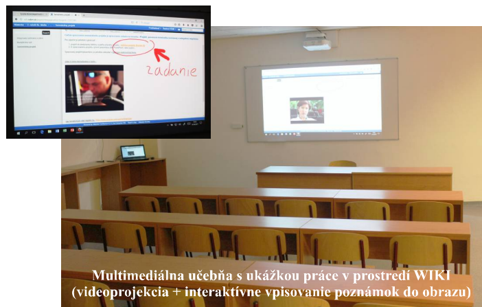
Multimediálna učebňa s ukázkou práce v prostredí WIKI (videoprojekcia + interaktívne vpisovanie poznámok do obrazu)

V suteréne ostali zachované: laboratórium GIS, špecializovaná PC učebňa, kde pribudli softvéry pre výuku predmetov špecializácie kybernetickej bezpečnosti, ďalej laboratórium elektroniky a technických bezpečnostných prostriedkov, laboratórium požiarnej ochrany, špecializovaná učebňa pre SBS, telocvičňa a posilňovňa. Týmto usporiadaním sa vytvoril priestor pre zriadenie multimediálnej učebne, ktorá je vrátane televízneho okruhu súčasťou technického zázemia pre riešenie projektu „Tvorba a testovanie prezentácií projektov prevencie kriminality súvisiacej s nelegálnou migráciou“ (Poskytovateľ: Obvodný úrad Košice, Výzva: MV SR/2016). Okrem suterénu je na prvom poschodí naďalej v prevádzke laboratórium analýzy rizík, ktoré je vybavené hardvérovou a softvérovou podporou hodnotenia rizík zväčša pre potreby doktorandov.