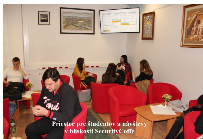
Priestor pre študentov a návštevy v blízkosti Security Coffe