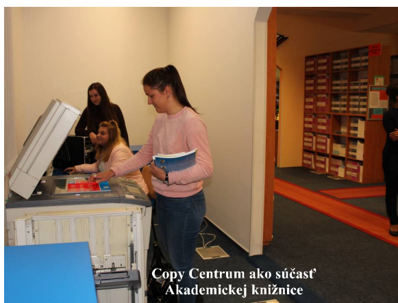
Copy Centrum ako súčasť Akademickej knižnice

V suteréne objektu, kde sú zväčša situované špecializované učebne a laboratóriá bolo vybudované samostatné laboratórium navigačných, mapovacích a monitorovacích systémov, ktoré bolo nutné z kapacitných dôvodov oddeliť od laboratória geografických informačných systémov. V rámci reorganizácie sa do nových priestorov presťahovalo aj laboratórium kriminalistiky, ako aj špecializovaná jazyková učebňa, ktorá sa z koncepčných, technologických a prevádzkových dôvodov presťahovala z tretieho poschodia do suterénu. V tejto učebni pribudlo 16 počítačov so slúchadlami, veľkoplošná projekcia a špecializovaný softvér pre individuálnu výučbu cudzích jazykov.