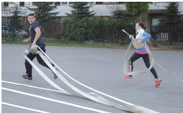
ilustračné foto: tréning členov DHZ VŠBM v KE

Zlomovým bodom a najmä krokom vpred v oblasti dobrovoľných hasičských zborov obce bol rok 2014, prijatím zákona č. 37/2014 o dobrovoľnej požiarnej ochrane, a následne niekoľkými novelizáciami vyhlášky č. 611/2006 o hasičských jednotkách, vyplývajúcimi tiež z koncepcie Ministerstva vnútra SR v spolupráci s Dobrovoľnou požiarňou ochranou SR o celoplošnom rozmiestnení síl a prostriedkov hasičských jednotiek na území SR. Dobrovoľným hasičským zborom obce sa vo zvýšenej miere začalo dostávať materiálo - technickej i finančnej pomoci, a pozornosti vôbec. Aj to sú dôvody rozvoja a zvyšujúcej sa aktivity týchto požiarňových jednotiek.