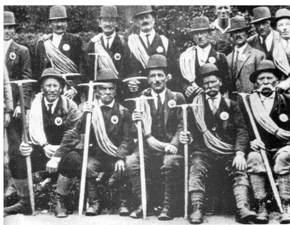
Horskí vodcovia v roku 1932

Odnepamäti chodili ľudia po horách. Hľadači pokladov, haviari, bylinkári, pastieri, poľovníci a v 16. storočí sa vo Vysokých Tatrách objavili prví turisti, ktorých po nebezpečných cestách vodili prví horskí vodcovia. Tí sa starali o bezpečnosť svojich zverencov a boli prví, ktorí im pomáhali pri úrazoch. Simplicissimus v cestopise z roku 1633 píše o viacerých tatranských obetiach, ale neopisuje konkrétne tragické udalosti, ani miesto, kde sa odohrali. Možno predpokladať, že veľa úrazov sa stalo pri ťažení rúd pod vysokotatranským Kriváňom, ale aj v Západných Tatrách. Dňa 28. februára 1856 obrovská lavína, ktorá sa zosypala pod štítom